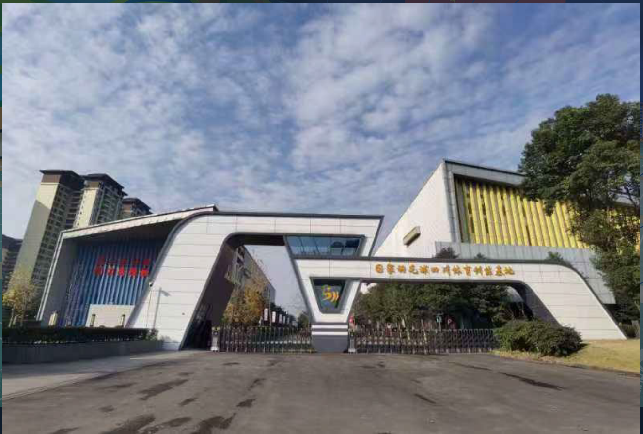
国家羽毛球四川体育训练基地