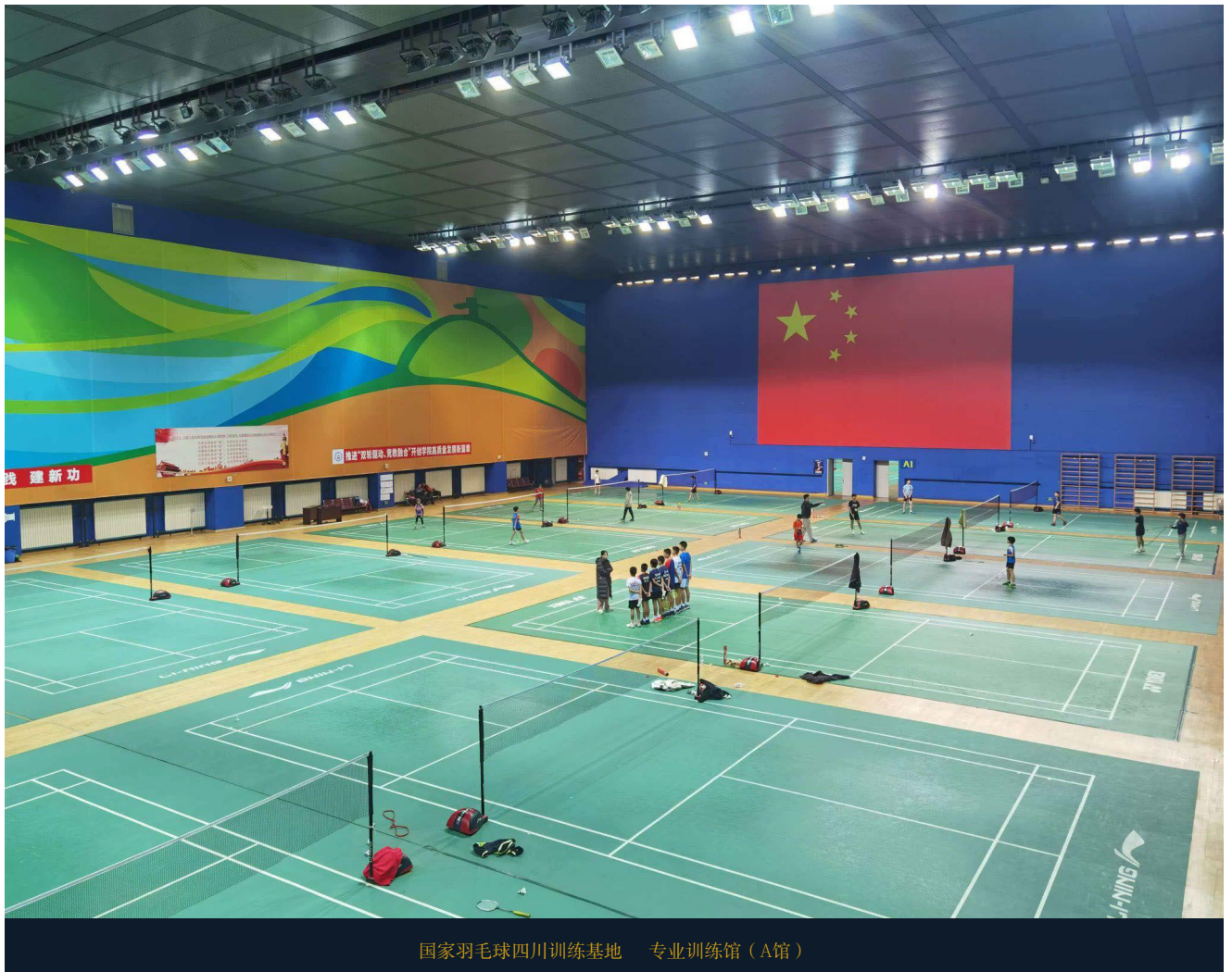
国家羽毛球四川训练基地 专业训练馆 (A馆)